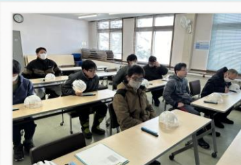
真剣に話を聞く皆さん