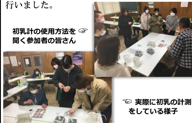
初乳計の使用方法を聞く参加者の皆さん